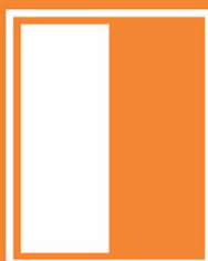
1/2 Trang đứng