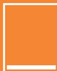
1/10 Trang ngang