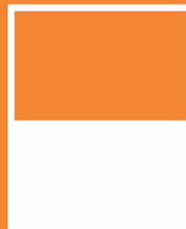
1/2 Trang ngang