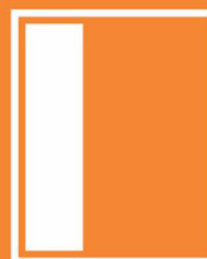
1/3 Trang ngang