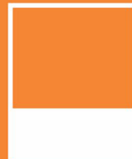
1/3 Trang ngang