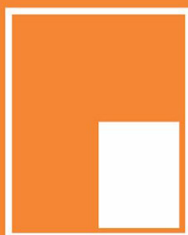
1/4 Trang đứng