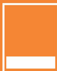
1/5 Trang ngang